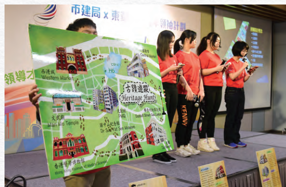
市建局透過舉辦各種有關市區重建的教育外展活動啟迪年青人。

年內，市建局舉辦了多項活動，啟發青年人思考與市區更新相關的議題。在二零一八／一九年度，市建局舉辦了一系列教育及推廣計劃，旨在接觸年輕一代，向他們解釋市建局的工作，為市建局建立正面形象。教育及推廣計劃的活動包羅萬有，包括與規劃署合辦暑期活動，為小學生安排簡介會及實地考察，以及與香港專業教育學院和香港知專設計學院合作舉辦「創意工程及建築設計比賽」，讓學生發揮創意，以智慧設計改善舊區的居住環境；市建局同時亦支持不同機構所舉辦的活動，例如由香港測量師學會舉辦的「構建『你』想」地區發展創意比賽，鼓勵年輕人將課堂所學應用在市區更新項目上；在二零一八至一九年與東華三院合辦的青年領袖計劃中，參與的同學獲分發「地方營造」、「智慧生活」及「樓宇復修」三個題目進行專題研習。通過舉辦實地考察、導賞團、到校分享會及工作坊等一系列活動，灌輸與專題研習題目有關的資訊和知識，並培育學生的領袖才能，學生亦需將學習到的市區更新知識與校內其他同學分享。