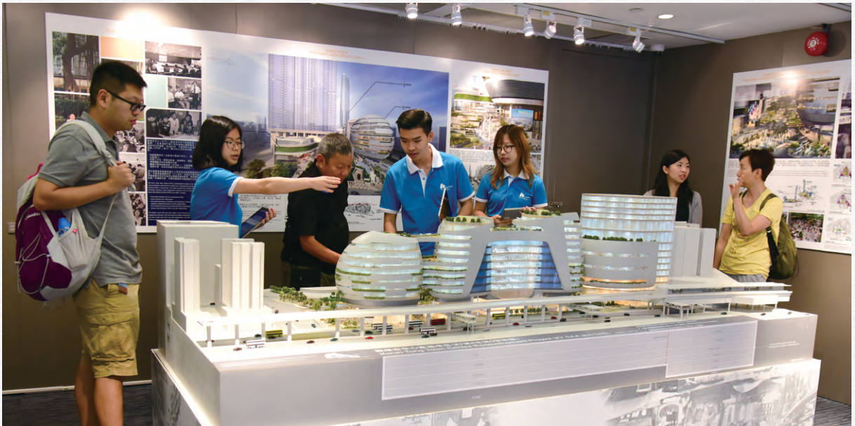
公眾參觀觀塘市中心重建項目第四及五發展區建築模型。

為加深市民對觀塘市中心重建計劃(K7)的認識，市建局於二零一八年十月十一日至三十一日進行了為期三周的模型及資訊展覽，超過四千七百名訪客及十九個地區組織、學校及政府部門到訪，以了解項目未來發展的整體設計及建議特色。