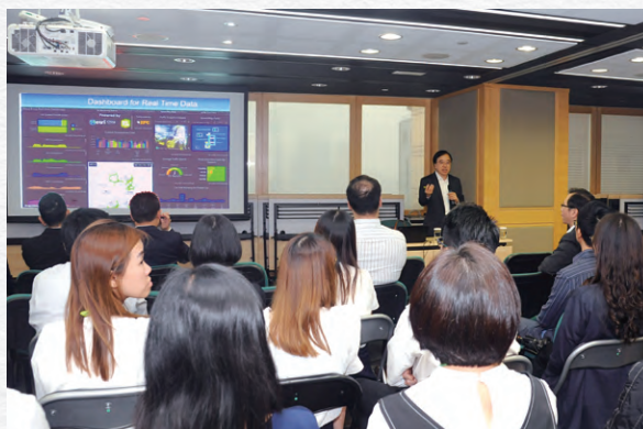
市建局為職員提供各類技術培訓。

一支投入而能幹的團隊，是市建局履行市區更新使命的重要基石。二零一八／一九年度的培訓重點繼續是推動不同職級員工學習最新技術，例如建築信息模型技術、智慧城市、人工智能、大數據、物聯網等。與此同時，市建局亦致力加強員工的技術知識及核心技能，例如溝通、持份者參與、創新、個人發展和領導才能。年內，市建局為約四千名參加者提供超過二十項新培訓課程、四十個參觀和講座，主要涉及可應用於市建局工作的創新項目與科技，合共約一萬二千八百個培訓課時。為了滿足員工的學習需求和維持企業發展，本局成立了一個培訓與發展專責