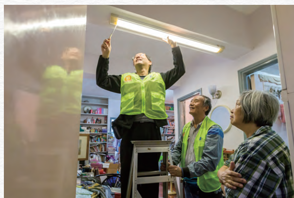
「守望相助」家居維修服務計劃的師傅義務協助獨居長者維修電器。

在過去一年，市建局贊助了兩家本地機構，在九龍城區及深水埗區開展「守望相助」家居維修計劃，為區內居住在舊樓而生活環境較差的家庭，特別是長者提供援助，計劃包括探訪低收入家庭，及提供免費的家居維修服務。自計劃推行以來，兩區的居民均反應良好，惠及超過四百個家庭。