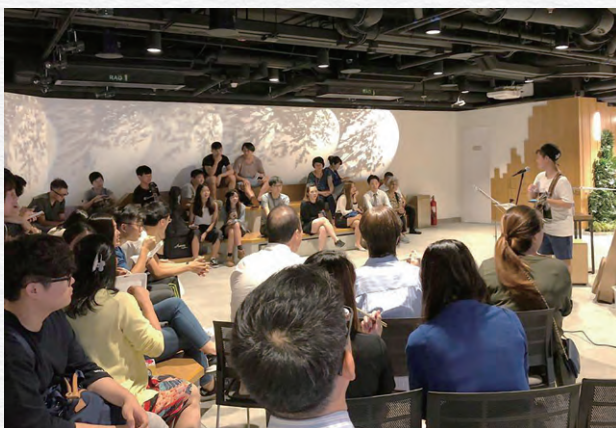
市建局舉辦的社區活動促進居民身心健康。

如《業務回顧》一章所述，我們在現時的項目內加入地方營造手法，藉以更善用公共空間供公眾享用。