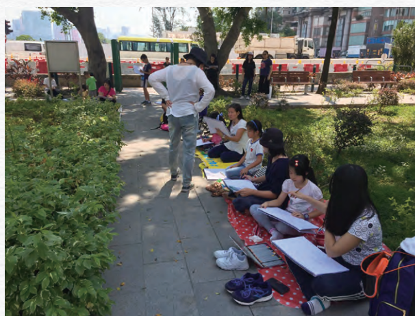
市區素描活動讓舊區居民享受藝術之餘，亦協助他們建立與社區的連繫。

鄰里不單是地理環境的概念，更是由當區文化和特色所塑造的社區認同感。能夠讓舊區居民欣賞社區藝術文化，可加深他們對地區的了解，並提升他們的生活質素。於二零一八／一九年度，市建局舉辦的「藝術文化融入舊區」夥伴項目先導計劃合共資助了九個項目，為舊區居民舉辦音樂及舞蹈、壁畫、市區素描等活動，為區內居民帶來文娛享受之餘，亦提升了舊區活力。於土瓜灣舉辦的「藝術在街角」屬於其中一個蘊含「地方營造」元素的活動，吸引了過百名區內居民參與，就當區的地標進行寫生活動，作品更製作成藝術裝置在土瓜灣區展出，讓公眾欣賞。自計劃推出以來，獲贊助的藝術及文化活動項目數目共有五十七項，惠及約六十六萬七千六百三十五名舊區居民，提升他們的生活質素。