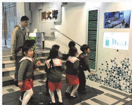
「H6 CONET」引入發電地磚，不單推廣節能，亦用作互動及教育用途。

在「H6 CONET」項目中，市建局以垂直綠化牆模式安裝了生物過濾系統，以改善室內空氣質素。系統經啟用後，空氣中的污染物例如揮發性有機化合物，PM10及二氧化碳顯著減少，讓到訪「H6 CONET」的人士能享用到清新的室內空氣。同時，亦在同文街入口安裝了先進的發電地磚，作為先導環保措施。此特製地板系統能利用電磁感應行人步行的動力，轉化為電力，並將收集到的可再生能源，即時為用作互動及教育用途的燈效顯示供電。我們將研究在未來的項目中進一步應用此系統。