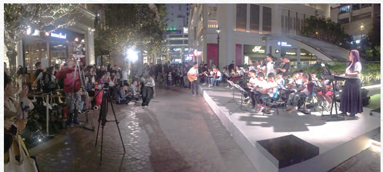
「市建童樂•社區樂團」透過音樂培訓及演出，強化參與學童及家長的社區網絡。

配合在土瓜灣區推出的多個重建項目，市建局於二零一八／一九年度，為當區成立首個「市建童樂•社區樂團」，通過定期訓練、表演及其他活動，維繫參與兒童和其家庭的社區網絡。市建局以全資贊助形式，資助了三十名於土瓜灣居住或上學、缺乏任何正統音樂訓練的低收入家庭兒童加入樂團，為他們提供免費音樂課堂。年內共安排了四次演出，參與兒童不但享受音樂訓練及表演，更從中建立彼此間的友誼，對計劃的反應非常正面。