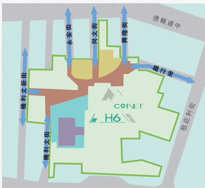
「H6 CONET」將毗鄰的六條街道開通連繫，提升步行可達性。